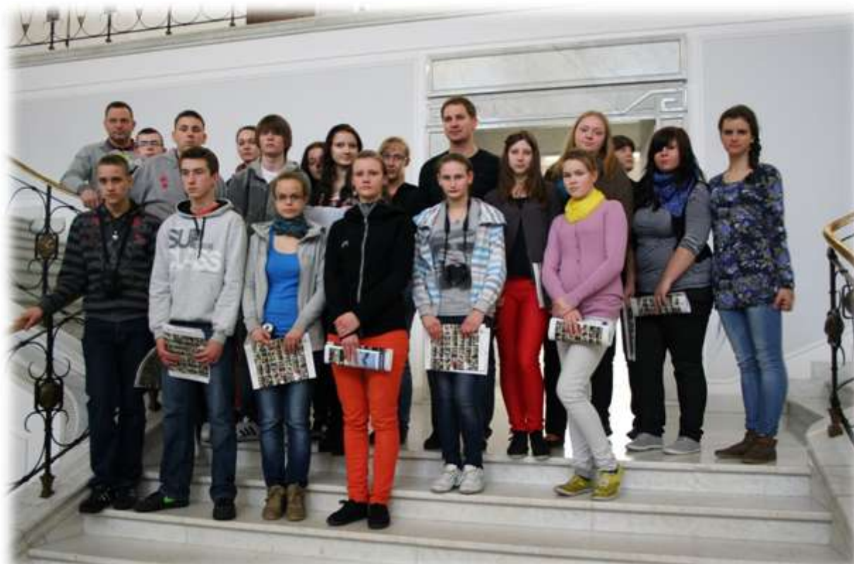
Uczestnicy wycieczki do Warszawy