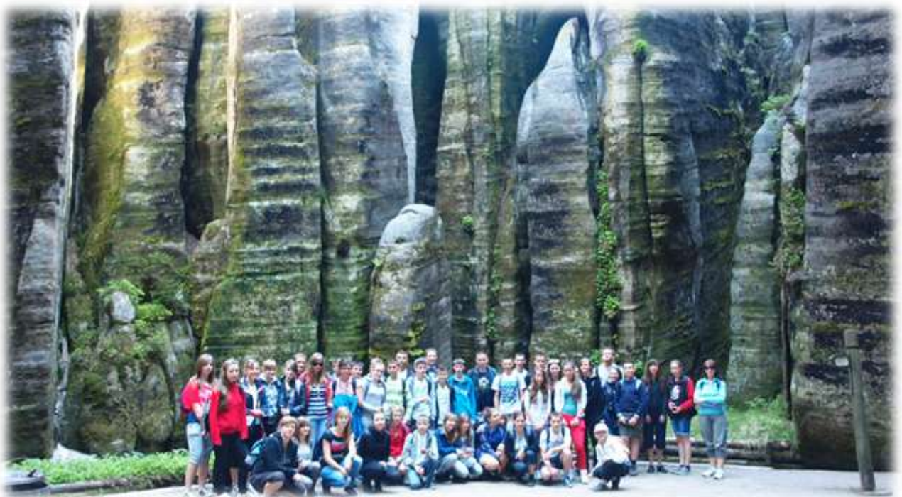
Uczestnicy wycieczki w Sudety