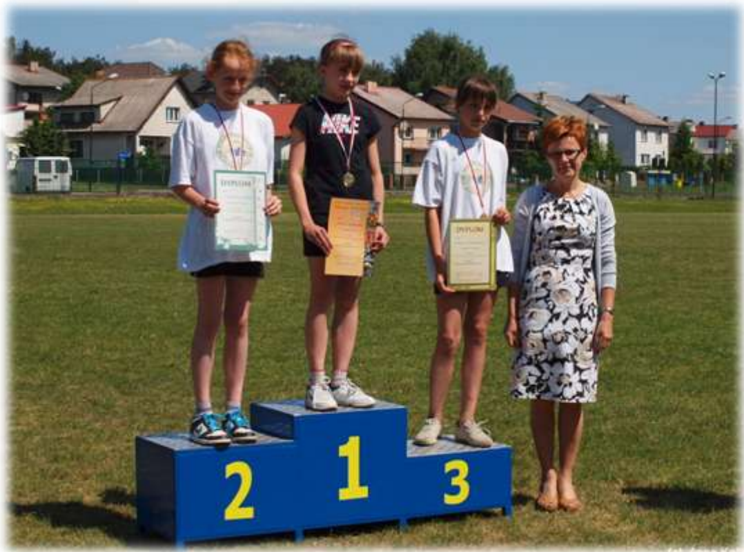
Święto Szkoły – 8 bieg