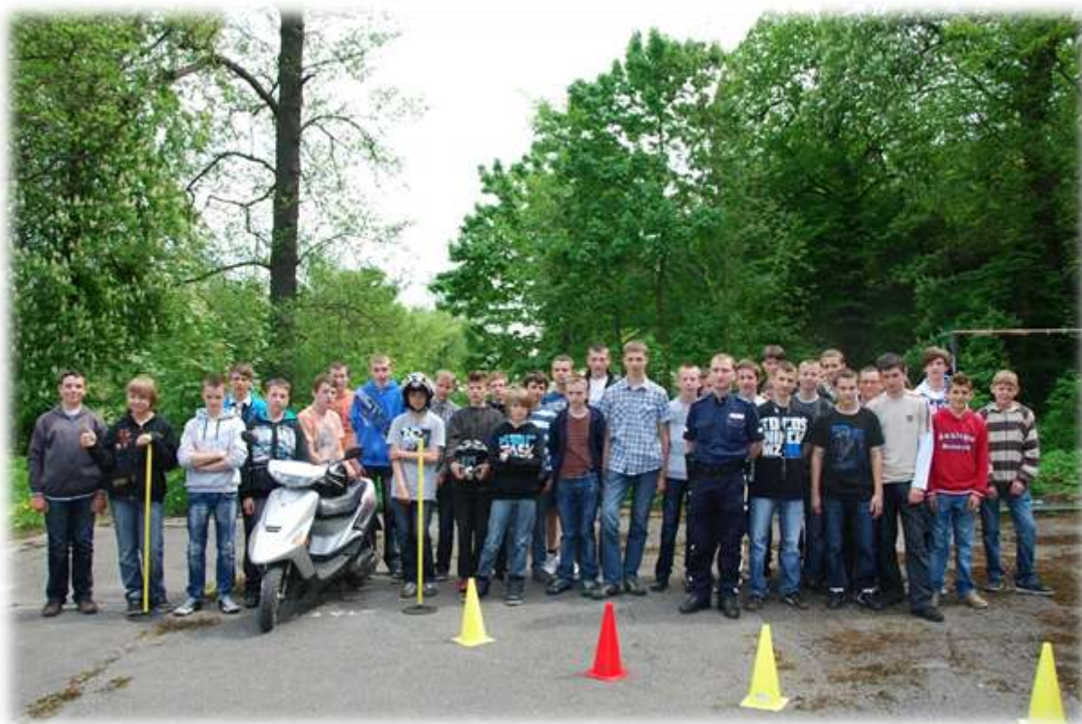
Uczestnicy egzaminu na kartę motorowerową